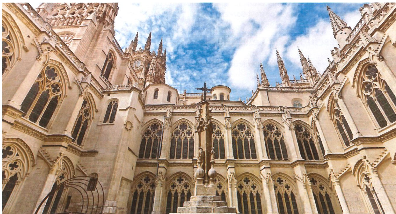
Kathedrale von Burgos

Hinweis: Unterwegs werden Sie gemeinsame Gottesdienste feiern.